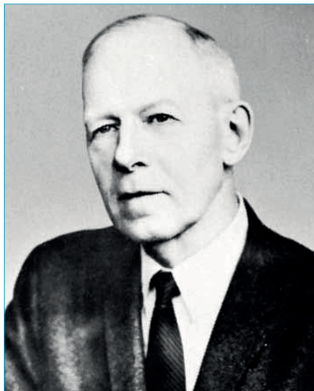
Figura 2. Robert Sanderson Mulliken (1896-1986). Físico y químico norteamericano galardonado el año 1966 con el Premio Nobel de Química.